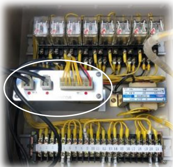
受信機取付け写真 (制御盤内)