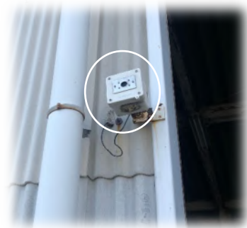
受光センサ取付け写真 (シャッター部)